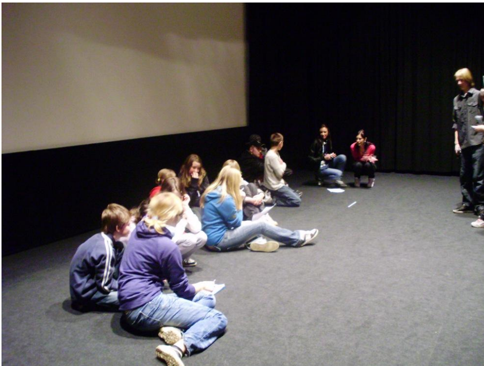
Aktivita ve formě soutěže pro školní týmy