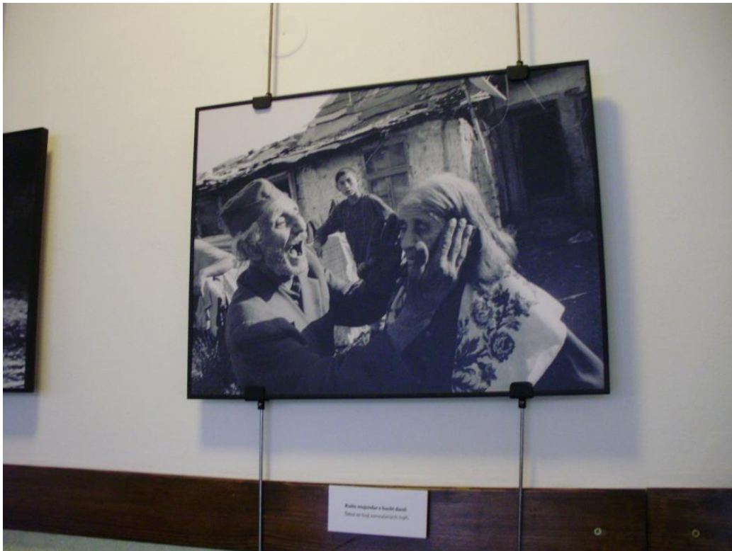
Výstava fotografky Hanky Šebkové Štěstí a vítr jedno jsou, součást doprovodného programu