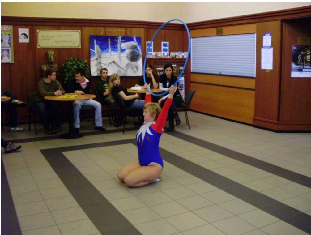
Gymnastické cvičení sportovkyně s mentálním postižením, zkouška