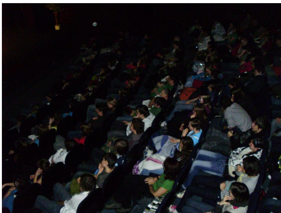
Žáci základních škol sledují jeden z dokumentů