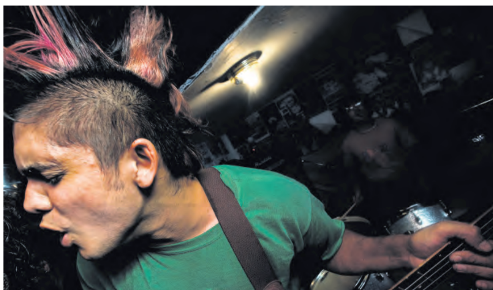
HUDBA, CESTA KE SVOBODĚ. Horní snímek je z dokumentu Afghánská superstar britské režisérky Havan Markingové, spodní z filmu Taqwacore: zrod islámského punku.