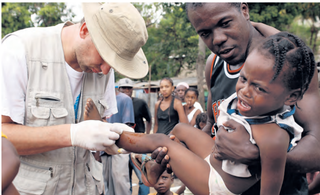
ZDEVASTOVANÉ HAITI. Krátce po zemětřesení na Haiti vyslala společnost Člověk v tísni na místo pohotovostní zdravotnický tým. Ošetřovali především zraněné a nemocné v provizorních táborech.