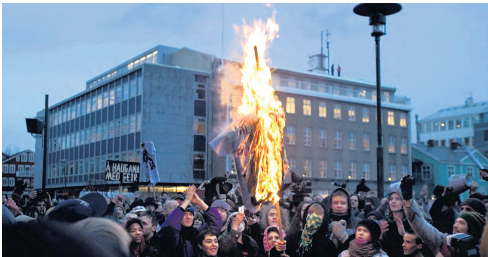
„KREPPA“ NA ISLANDU. Ještě před pár lety nikdo nevěřil, že dvacátá nejbohatší země světa okusí bankrot státu. Ale stalo se. Jeho dopady vykresluje snímek Bůh žehnej Islandu.

Ekonomické zvraty posledních let v komentáři ekonoma Aleše Michla